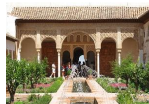
Дом-музей Федерико Гарсия Лорки