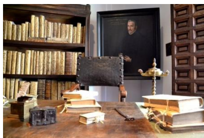
Дом-музей Лопе де Вега

Понедельник. Мадрид. Пешеходная ознакомительная экскурсия по Мадриду. Посещение кафе Gran Café de Gijón, место встречи писателей и литераторов Поколения 98. Посещение Дома - музея Лопе де Вега. Ужин со спектаклем Фламенко.