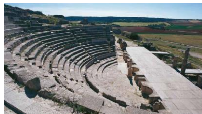
Руины театра Сегобрига

Среда. Переезд на автобусе в регион Андалузии. Экскурсия по городу Гранада. Посещение Дома - музея Федерико Гарсия Лорки. Прогулка по центру города. Ужин со спектаклем Фламенко. Размещение в отеле г.Гранада