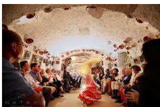
Фламенко в Гранаде.

Среда. Переезд на автобусе в регион Андалузии. Экскурсия по городу Гранада. Посещение Дома - музея Федерико Гарсия Лорки. Прогулка по центру города. Ужин со спектаклем Фламенко. Размещение в отеле г.Гранада