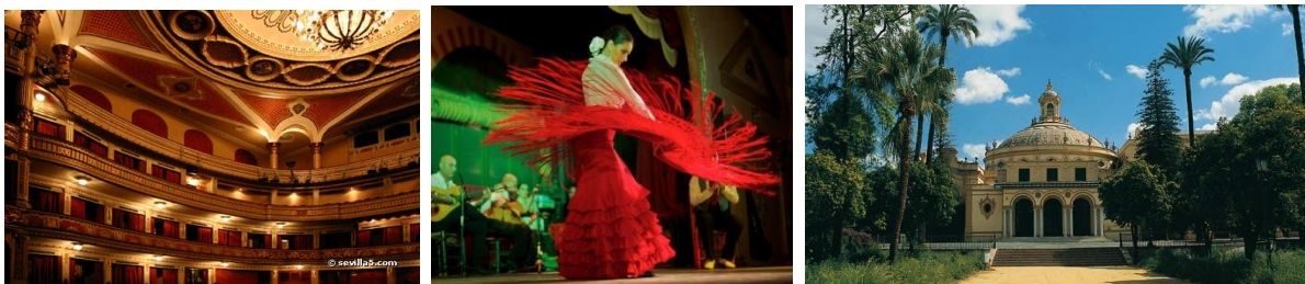
Театр Лопе де Вега

Четверг. Переезд в Севилью. Экскурсия по городу. Посещение театра Лопе де Вега. Ужин со спектаклем Фламенко. Размещение в гостинице в г.Севилья.