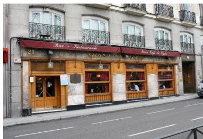
Кафе Gran Café de Gijón

Вторник. Кастилья ла Манча. Посещение руин римского театра Сегобрига. Концерт в Филармонии города Куэнка. Обед.