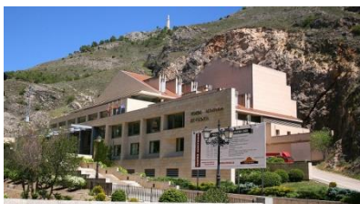
Филармония в г. Куэнка

Вторник. Кастилья ла Манча. Посещение руин римского театра Сегобрига. Концерт в Филармонии города Куэнка. Обед.