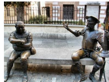
Памятник Дон Кихоту и Санче Пансо