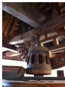
Консуэгра. Ветряные мельницы

Пятница. Прогулка по Мадриду. Посещение музея Прадо.