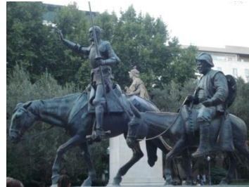
Мадрид Пласа Испании

Вторник. Кастилья ла Манча. Посещение города Толедо. Осмотр Кафедрального Собора, садов Дворца Галиана, Дома музея Эль Греко. Дом Сервантеса на площади де лос Тинтес. Обед. Посещение Дома - музея Сервантеса в городе Эскивиас. Дом-музей, где творил Сервантес свой мировой шедевр и прожил счастливые годы с Каталиной.