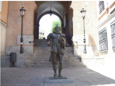
Толедо. Памятник Сервантесу

Вторник. Кастилья ла Манча. Посещение города Толедо. Осмотр Кафедрального Собора, садов Дворца Галиана, Дома музея Эль Греко. Дом Сервантеса на площади де лос Тинтес. Обед. Посещение Дома - музея Сервантеса в городе Эскивиас. Дом-музей, где творил Сервантес свой мировой шедевр и прожил счастливые годы с Каталиной.