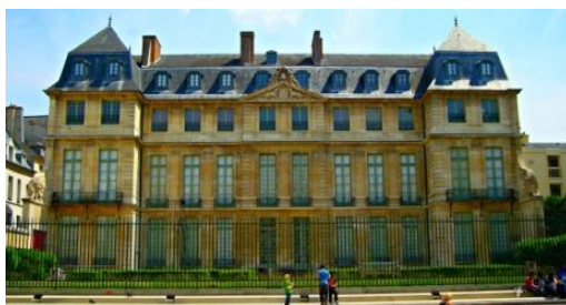
Барселона. Музей Пикассо.

Суббота. Обзорная экскурсия по Барселоне. Посещение Музея Пикассо. Ночной переезд в Мадрид.