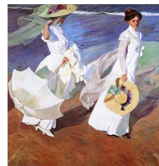
Х.Соролья «Прогулка по морю»

Среда. Кастилья ла Манча. Экскурсия по городу Толедо. Посещение Дома - музея Эль Греко.