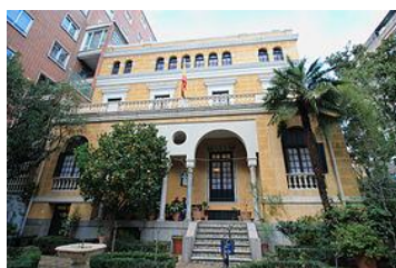
Дом-музей Хоакина Сорольи

Вторник. Испанские импрессионисты. Посещение Дома-музея Хоакина Сорольи.