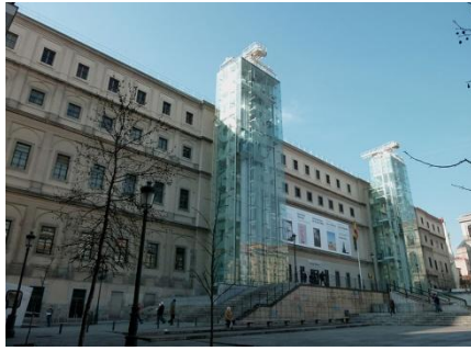
Музей Королевы Софии

Четверг. СОВРЕМЕННОЕ ИСКУССТВО. Посещение Музея Королевы Софии. Посещение тематической выставки в Caixa Forum.