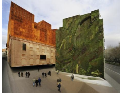
Музей Caixa Forum