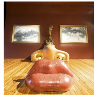
Фигейрос. Дом-музей С.Дали

Суббота. Обзорная экскурсия по Барселоне. Посещение Музея Пикассо. Ночной переезд в Мадрид.