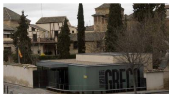
Толедо. Дом-музей Эль Греко

Среда. Кастилья ла Манча. Экскурсия по городу Толедо. Посещение Дома - музея Эль Греко.