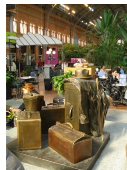
Мадрид. Вокзал Аточа